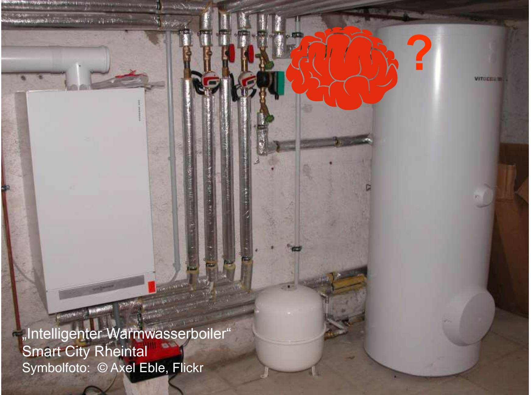
„Intelligenter Warmwasserboiler“ Smart City Rheintal